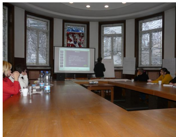
kurzy konané v rámci projektu Rady vlády (Sociálně-právní minimum, Specifika práce v romské komunitě)